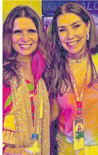
Desfile das campeãs no Camarote Arara: Malu Mader e Denise Montenegro