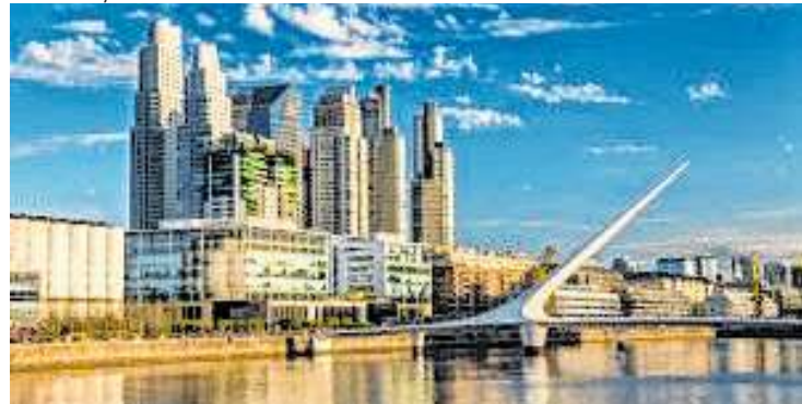
Booking.com listou os destinos nacionais e internacionais

A agência de viagens Booking.com realizou um levantamento que prever buscas no Brasil por viagens para 2023. Segundo apontamentos, 81% dos brasileiros acredita que sempre valerá a pena viajar e 57% terão prioridade de investir nas férias para isso. O ranking feito pela pesquisa indica que a tendência nacional está centralizado nas regiões Sul e Sudeste. As capitais e cidades no interior do País, ainda segundo o